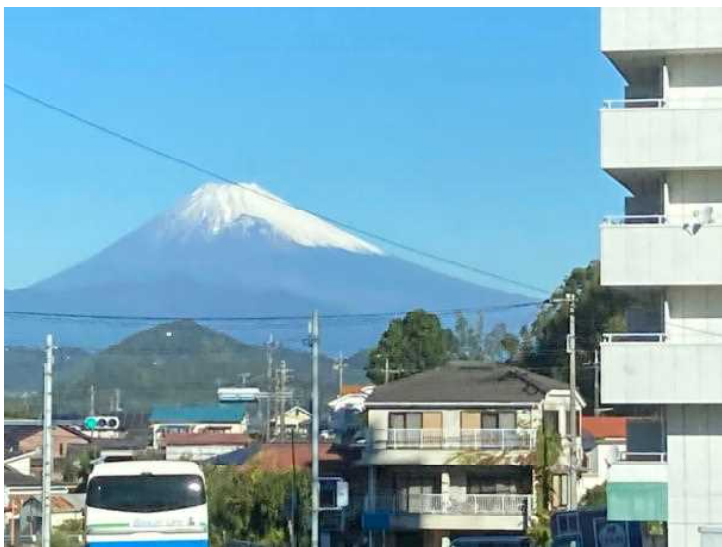
富士山がどんどん近づいてきます。