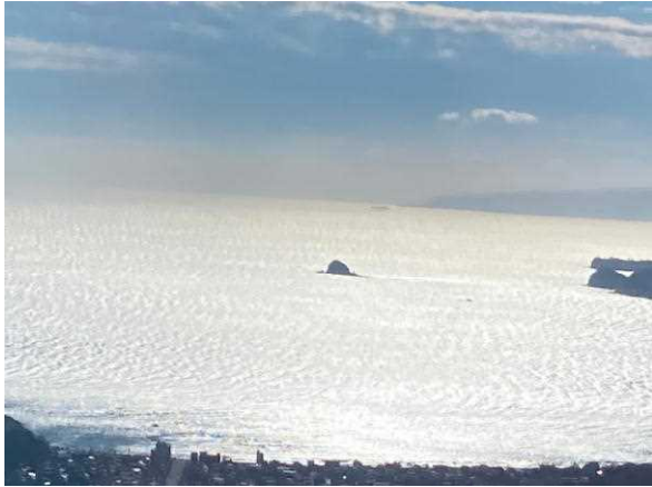
東伊豆の海は朝日に輝いていました。