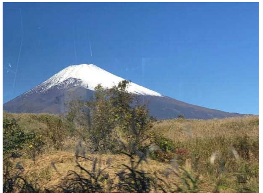
宝永の噴火口も正面に見えていますね。