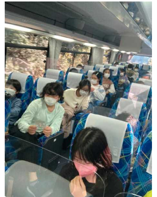
バスではガイドさんがビンゴをしてくれました。